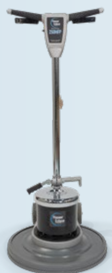
Polisseuse à plancher de 20" avec entraîneur de disque