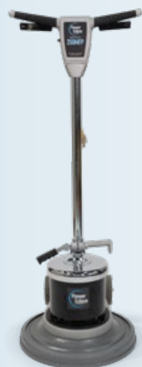
Polisseuse à plancher de 17" avec entraîneur de disque