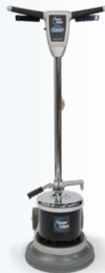
Polisseuse à plancher de 13" avec entraîneur de disque