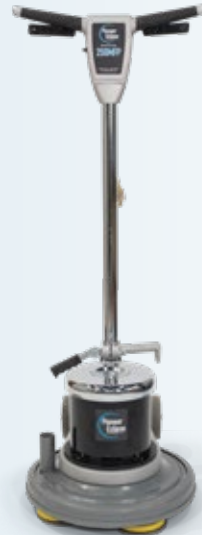
Meuleuse/polisseuse planétaire de 17" avec entraînement par engrenage et collerette